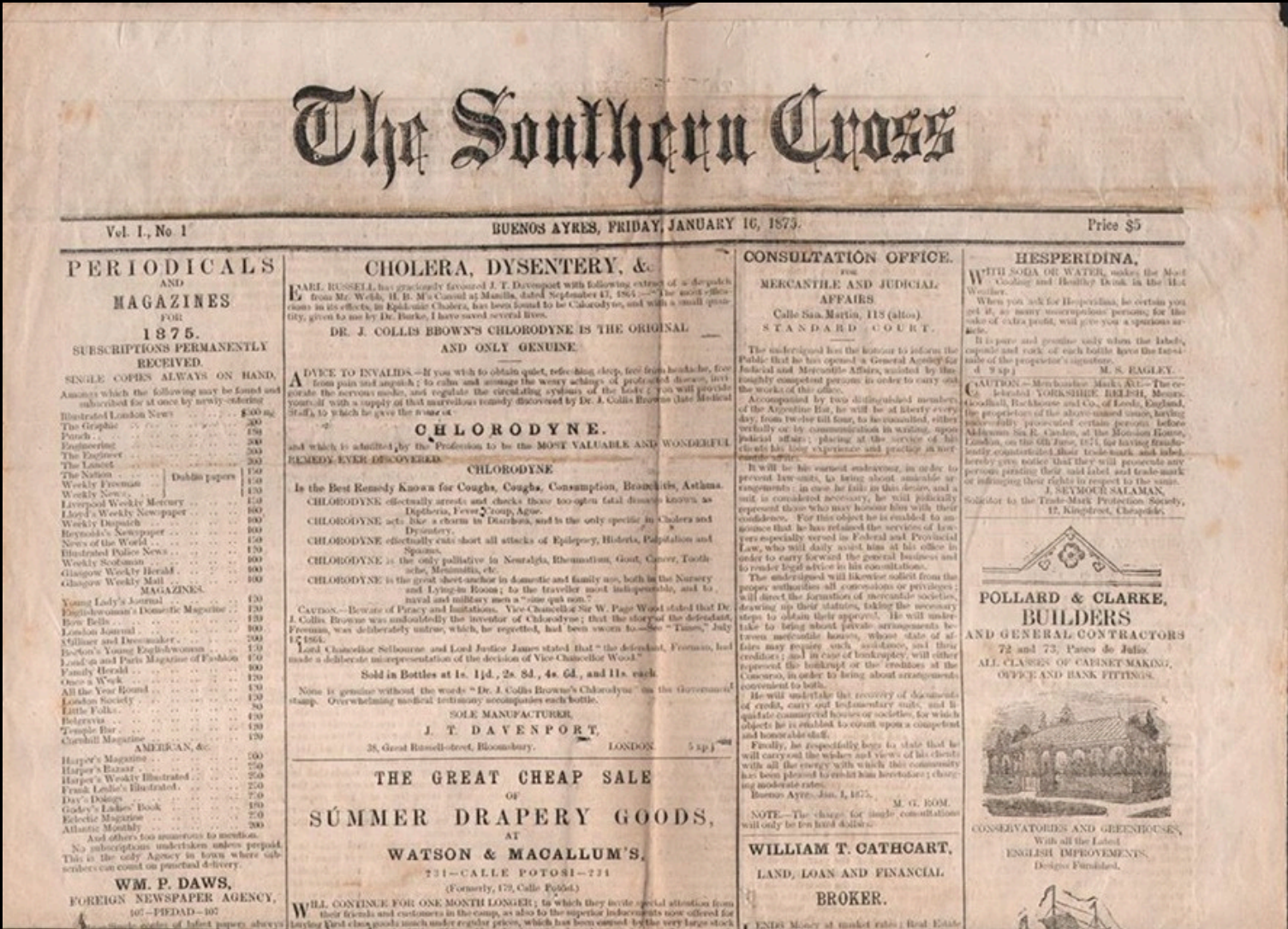
Tapa de la primera edición

SU PRIMERA TIRADA FUE EL SÁBADO 16 DE ENERO DE 1875, EL MISMO SALÍA EN IDIOMA INGLÉS. EL MISMO GANA RÁPIDAMENTE PRESTIGIO, Y PASO DE 4 A 20 PÁGINAS, EN CADA EDICIÓN SEMANAL. YA EN EL S. XXI SE PUBLICA EN ESPAÑOL.