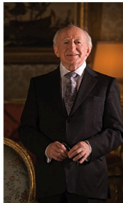
S. E. Michael D. Higgins

Mantendrá reuniones de trabajo con funcionarios nacionales y con diversos empresarios, con el objeto de promover e intensificar las relaciones económicas y la ayuda mutua entre ambos países. Es la segunda vez que visita Argentina.